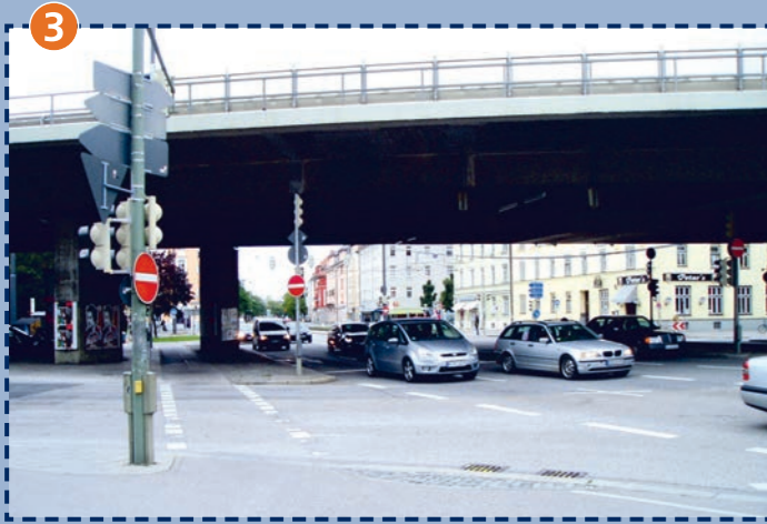
Kreuzung Arnulfstraße/Donnersbergerbrücke (stadtauswärts)