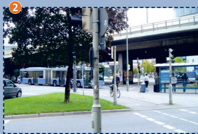
Kreuzung Arnulfstraße/Donnersbergerbrücke (stadteinwärts)